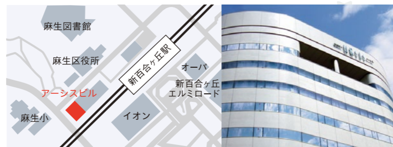
新宿から小田急線 快速急行21分 新百合ヶ丘駅 徒歩3分

代表者 樋口 荘祐 資本金 1億7,592万円 従業員数 70名 売上高 25億1,774万円 (2025年12月期単体) 上場市場 東証スタンダード市場 4171 連結子会社 株式会社ギブテック